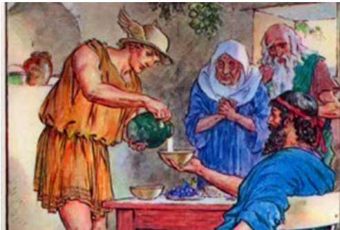
Filemón y Baucis

Lee el siguiente texto y luego responde la pregunta asociada, pensando en los pasos mentales que realizas para llegar a la alternativa que consideras correcta.