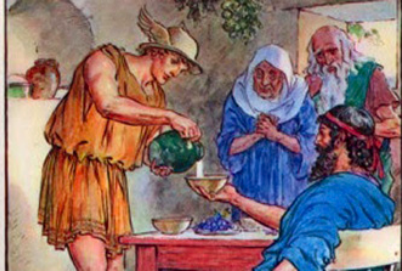
Filemón y Baucis

Filemón y Baucis fueron una pobre pareja que vivía en la zona de Frigia. Zeus había observado que, por aquellos territorios, existía un gran número de familias que vivían en humildes chozas poco acogedoras con los visitantes que por allí pasaban. Enojado por la falta de cordialidad de tales habitantes, decidió investigar un poco.